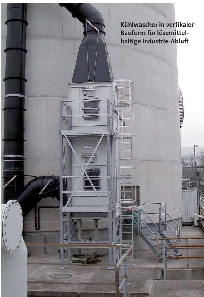
Kühlwascher in vertikaler Bauform für lösemittelhaltige Industrie-Abluft

Haupteinsatzgebiet des Luftwaschers ist die adiabatische Luftbefeuchtung. Während der Kontaktdauer im Luftwascher