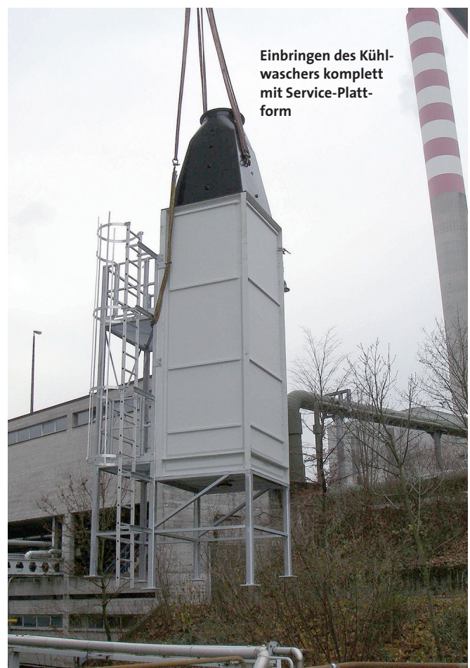
Einbringen des Kühlwaschers komplett mit Service-Plattform