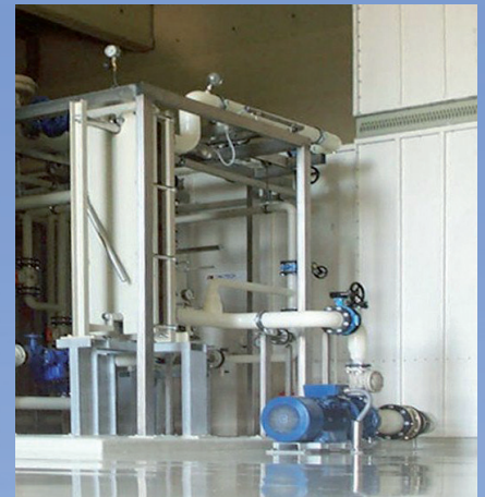
Der Absorptionstrockner arbeitet auf Basis einer Salzlösung; auf den Einsatz mechanischer Kälteerzeugung kann verzichtet werden

eingebundenen Regenerator wieder aufkonzentriert und erneut dem Konditionierer zugeführt. Dieser Prozess läuft dabei kontinuierlich, also nicht zyklisch ab. Der Salzlösung muss dafür direkt oder indirekt Wärme zugeführt werden, damit der (im Konditionierer)